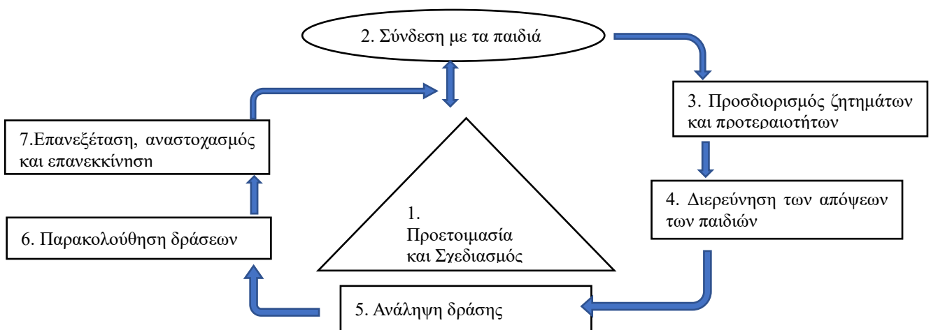
Σχήμα 1: Η συμμετοχή ως κυλιόμενη διαδικασία που παράγει αλλαγή 3

Υπό το πρίσμα αυτών των θεωρήσεων, το Συμβούλιο της Ευρώπης και οι εθνικές αντιπροσωπείες ενθαρρύνονται να αναλογιστούν πώς οι διαβουλεύσεις με τα παιδιά θα μπορούσαν να επηρεάσουν τις διαδικασίες αλλαγής ακόμη και πέρα από τον συγκεκριμένο στόχο της παρούσας διαδικασίας. Καλούνται να αναλογιστούν την δυνατότητα να καταστεί δυνατή μια ισχυρότερη συνέχεια ακρόασης και λήψης υπόψη των απόψεων των παιδιών στις διαδικασίες λήψης αποφάσεων, για τη διάρκεια της πενταετούς στρατηγικής, εάν όχι και πέραν αυτού του συγκεκριμένου χρονικού διαστήματος. Οι διαβουλεύσεις θα μπορούσαν να θεωρηθούν ως το θεμέλιο για μια συνεχή και σχετική ανταλλαγή με τα παιδιά σχετικά με τον προσανατολισμό των αστικών, πολιτιστικών, πολιτικών, κοινωνικών και οικονομικών διαδικασιών λήψης αποφάσεων, ως μία σημαντική ευκαιρία για όλους τους εμπλεκόμενους ενδιαφερόμενους σε εθνικό και Ευρωπαϊκό επίπεδο. Το Σχήμα 1 κάτωθι, παραπομπή από το Εγχειρίδιο Άκου – Δράσε - Άλλαξε, απεικονίζει αυτήν τη διαδικασία.